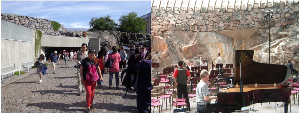
左圖：岩石教堂外觀 右圖：岩石教堂內部