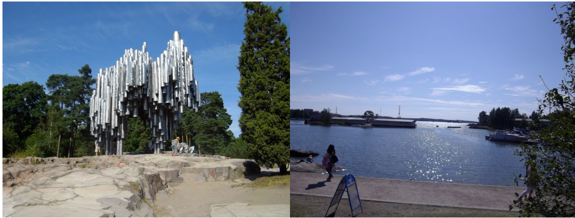
左圖：西貝流士公園 右圖：公園下方臨波羅的海