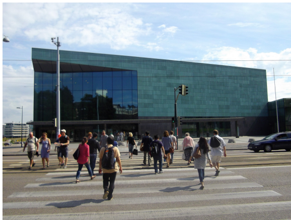
2011 年啟幕的赫爾辛基音樂中心