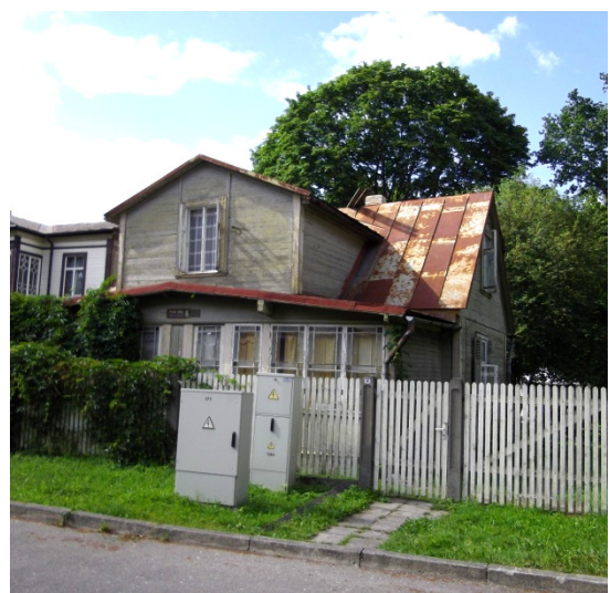
朱馬拉是當年拉脫維亞有錢人住的地方，現已有些沒落。左圖是現在拉脫維亞新的大型公園。右圖則為沒落的住宅區房屋。