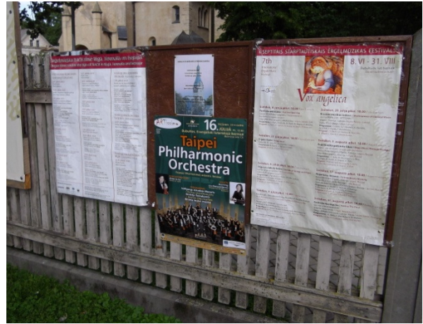
左圖是在教堂內排練的情形。右圖是教堂外的圍牆上有本次演出的宣傳海報。